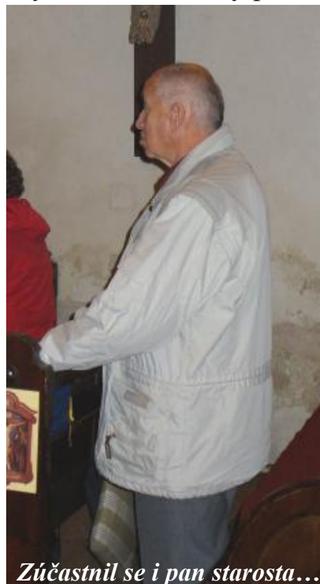
Zúčastnil se i pan starosta...