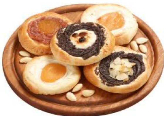
Okusili jsme i koláčky i dobré víno i spoustu jiných laskomin...