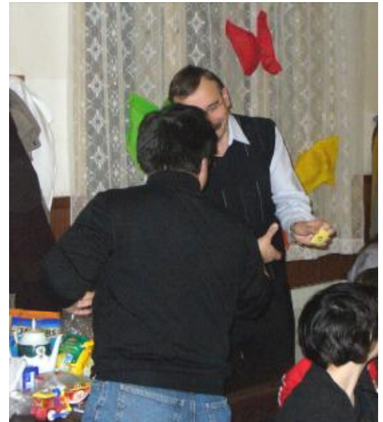
...no, neříkali jsme to?