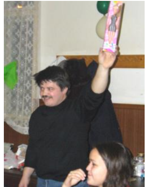
...a další exkluzivní cena. Kdopak ji asi vyhraje?