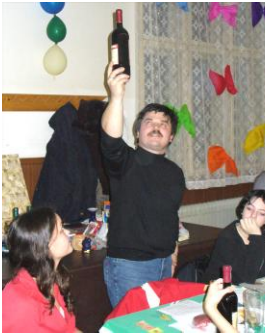
Rozjíždí se další kolo tomboly – vyhrává číslo...