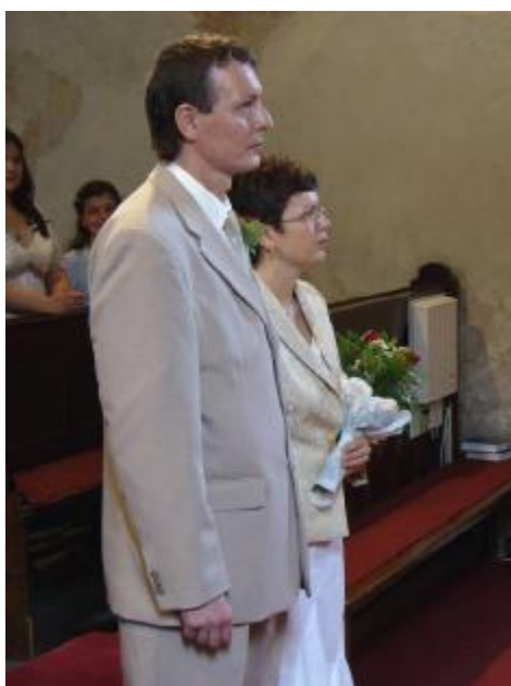
26.5. – svatba