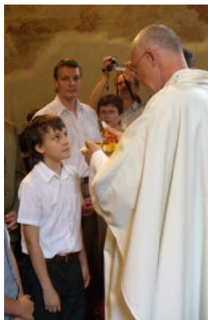
10.6. – 1.sv.přijímání