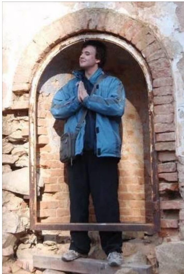
Tohohle svatouška bychom měli odněkud znát...

Hledám slova, která by vystihla i to „dění“, které není vždycky viditelné. Uvědomila jsem si, jak jsou všichni (nejen) ve své podstatě krásní a jak je obohacující s nimi být. Bylo mi tam prostě moc dobře; atmosféra svobody a důvěry, kdy člověk zatouží vycházet ze sebe sama, i když mi v tom může bránit moje povaha. Ex-sisto – z lat. vycházím, vynořuji se, vystupuji, je nejen etymologickým základem slova existence, ale snad i jeho hlubším významem. Pootevřít závory vlastní uzavřenosti a vstoupit do setkávání. Jako celý advent oslovuje tichou, skrytou nadějí, blízcím se světélkem betlémským, jehož naplněním je setkání s křehkým Ježíšem, tak i druhý adventní víkend ve Voticích byl pro mě milou zkušeností o Božím přicházení k nám.