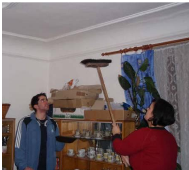
Počkej, já ti toho pavoučka nadeženu!